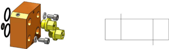
Abb. 74 Anschlussplatte für Magnetventil AP-1107.

Der Anschluss erfolgt mit Hilfe der G1/4" Anschlüsse für Eingang und Ausgang.